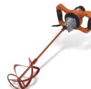
RUBIMIX 9 BL PLUS