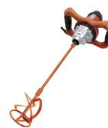
RUBIMIX 9 BL